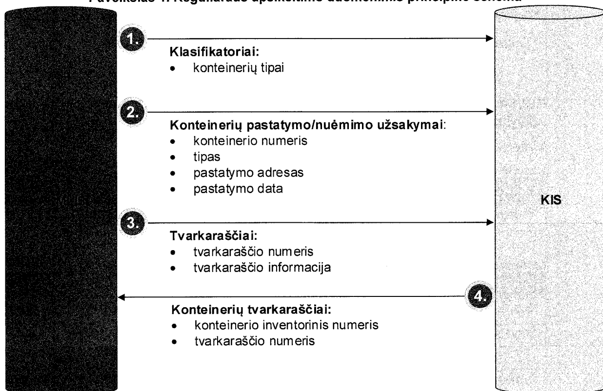
Paveikslas 1. Regularaus apskeitimo duomenimis principinė schema

Regularaus apskeitimo duomenimis metu KIS iš ASMLIS gauna informaciją apie ASMLIS valdomus konteinerių tipus, užsakymus konteinerių pastatymui ir nuėmimui bei tvarkaraščių sąrašą. KIS perduoda ASMLIS informaciją apie tai, koku tvarkaraščiu aptarnaujami konteineriai, bei artimiausius konteinerių aptarnavimo maršrutus.